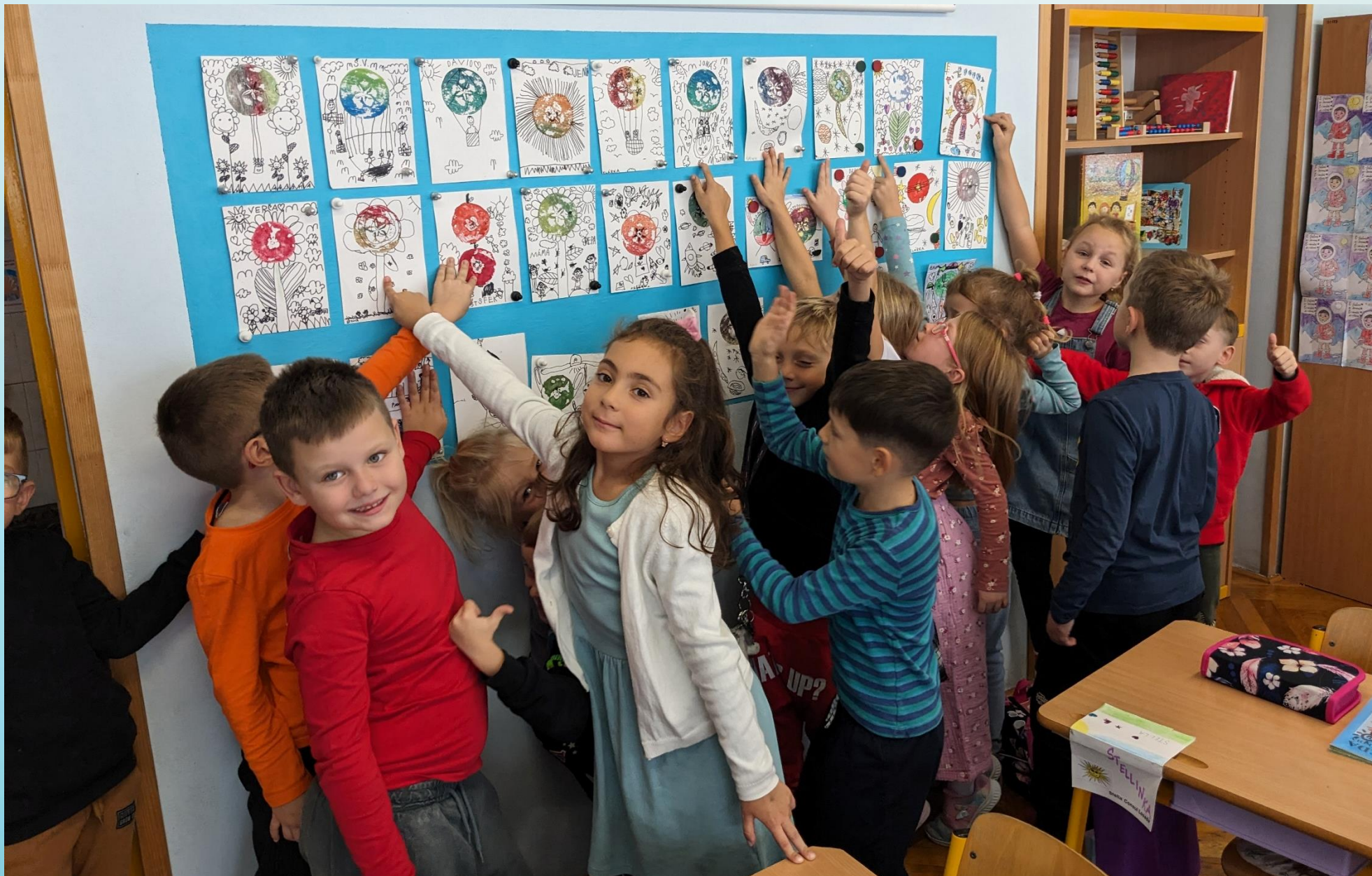
STROMY A MY- prezentace naší práce