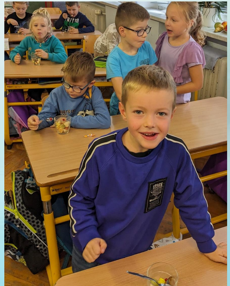
Projekt STROMY A MY výuka v prvouce - ovocný salát s jablíčky